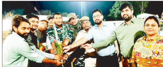
मतदान दल का स्वागत करते कलेक्टर।