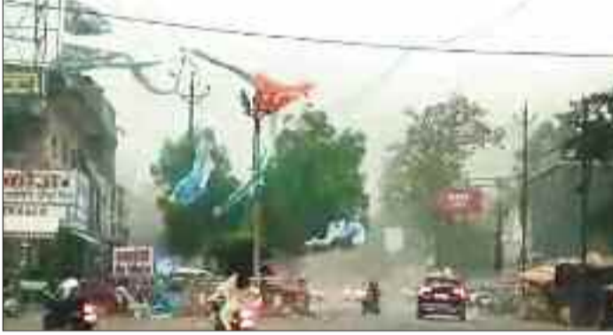
तेज आंधी बारिश से सड़कों में छरी घूल।