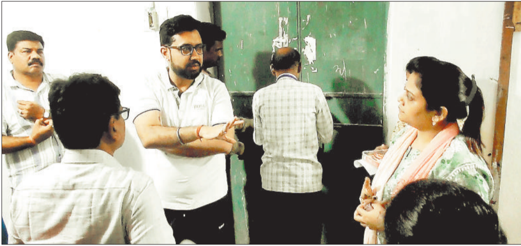
स्ट्रांग रूम किया गया सील।