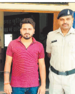
पुलिस गिरफ्तार में आरोपी।