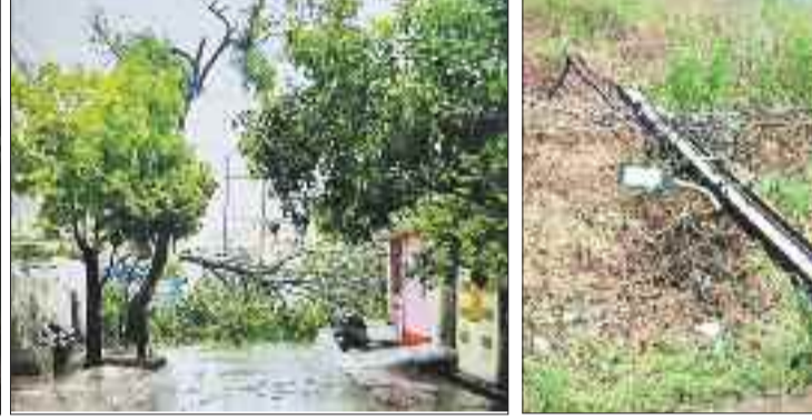
पेड़ से गिरी उमाल।

उल्लेखनीय है कि मंगलवार की सुबह से ही मौसम में हल्की ठंडकता थी और बादल छाए हुए थे। शाम होने के पहले ही तेज आंधी तूफान शुरू हो गई और तेज अंधड़ की वजह से शहर के कई इलाकों में विद्युत व्यवस्था ध्वस्त हो गई। बताया जाता है कि तेज आंधी तूफान की वजह से कई इलाकों की विद्युत व्यवस्था विद्युत