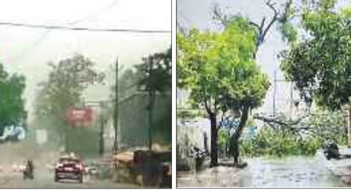
पेड़ से गिरी उमाल।

उल्लेखनीय है कि मंगलवार की सुबह से ही मौसम में हल्की ठंडकता थी और बादल छाए हुए थे। शाम होने के पहले ही तेज आंधी तूफान शुरू हो गई और तेज अंधड़ की वजह से शहर के कई इलाकों में विद्युत व्यवस्था ध्वस्त हो गई। बताया जाता है कि तेज आंधी तूफान की वजह से कई इलाकों की विद्युत व्यवस्था विद्युत