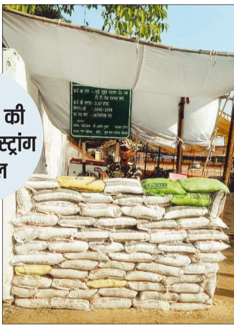
सुरक्षा में तैनात जवान।